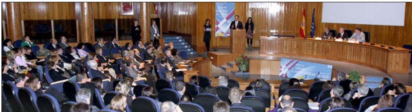
Imagen general de la sala del Ministerio de Sanidad en la que se entregaron los Premios a la Calidad del SNS.