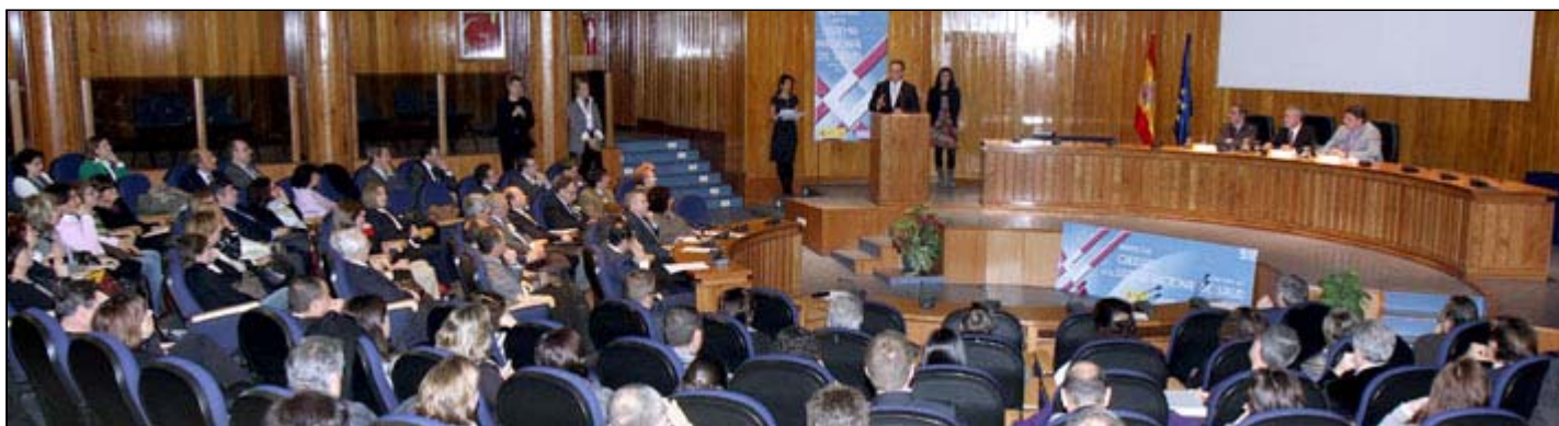
Imagen general de la sala del Ministerio de Sanidad en la que se entregaron los Premios a la Calidad del SNS.