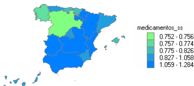
Ilustración 1. Demanda de medicamentos (resultados por CCAA)

En las CA de Aragón, Andalucía, Extremadura y La Rioja se consumen más medicamentos que en el resto. Por la parte baja de la tabla repiten Cantabria, Baleares y Galicia (con diferencias significativas). Es decir en estas CA existe una tendencia a que a igualdad del resto de condiciones los individuos consuman menos medicamentos. La Ilustración 1 muestra gráficamente los datos del cuadro anterior.